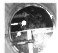
処理槽内部の様子