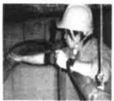
排水管清掃の様子

当社ではディスポーザ排水管の他、雑排水管や雨水管など、管種や使用用途に応じて適切なサイクルでの清掃をご提案させていただいております。