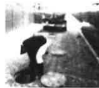
排水処理槽点検の様子

ディスポーザからの排水は、キッチン専用の排水管からマンションの敷地内にある「ディスポーザ排水処理槽」へ流れていきます。