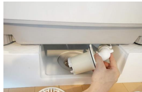
排水口が前面になるように設置してください。