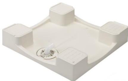
かさ上げタイプの洗濯機防水パン