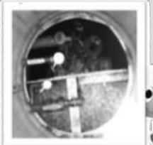
処理槽内部の様子