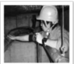
排水管清掃の様子

当社ではディスポーザ排水管の他、雑排水管や雨水管など、管種や使用用途に応じて適切なサイクルでの清掃をご提案させていただいております。