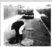
排水処理槽点検の様子

ディスポーザからの排水は、キッチン専用の排水管からマンションの敷地内にある「ディスポーザ排水処理槽」へ流れていきます。