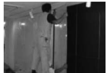
ホワイトボード設置工事

工事に伴ってリフォームをご検討されるお客様も少なくありません。専有部・共用部を問わず、設備機器類(トイレやキッチン、ユニットバスなど)のリフォームはもちろんのこと、例えば壁面をホワイトボードにすることなども可能です。普段は掲示板、理事会の際にはミーティングボード、キッズルームでは落書きスペースにとデッドスペース壁面をホワイトボードにするだけで、いろんな用途での使用が可能となります。このホワイトボードはホーロー製で傷がつきにくく、色目もインテリア性のある石目調や木目調もあります。こんなことはできるかな...と悩んだ時、皆様のご要望に応じたご提案が可能な当社に、ぜひ一度ご相談ください。